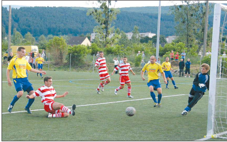
A diósgyőri labdarúgók felkészülési mérkőzéseken erősítenek a július 21-én kezdődő, új bajnoki idényre.