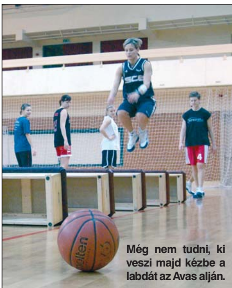
Még nem tudni, ki veszi majd kézbe a labdát az Avas alján.