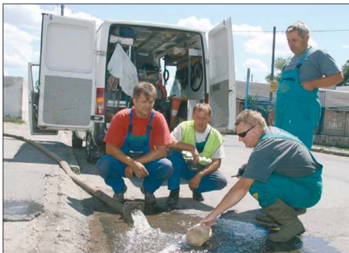
Augusztus 10-re befejezik a szivacsos csőtisztítást.