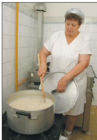
Az EU-normák mást írnak elő.

– Mi sem örülünk, ha ilyen intézkedéseket kell meghozni, de ez még mindig a kisebbik rossz. Alternatívaként ugyanis az szerepelt, „szervezzék ki” a főzést az önkormányzat hatásköréből, és bízzák egy külső cégre. Gyekertünk minden körülményt mérlegelni, s megítélésem szerint a lehetőségekhez képest jó döntés született – jelentette ki a képviselő.