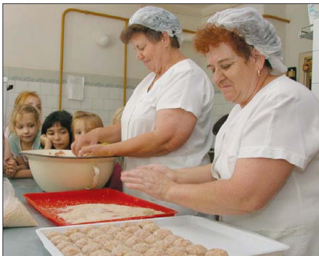
Az utolsókat gyúriják már.

– Az intézkedés a jövő évtől már 70 milliós megtakarítást eredményezhet – sorolja. Az egyeztetések során messzemenően tekintettel voltunk és leszünk a gyerekek érdekeire, igényeire: a Középkerületi óvoda főzőkonyhája például az ételallergiás és más megbetegedésekben szenvedő gyermekek különleges konyhájaként működik tovább. (szepesi)