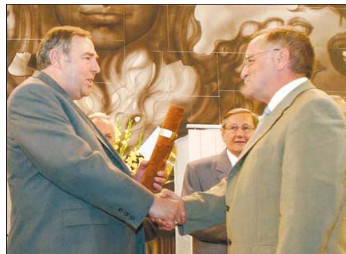
„Az egyetemnek van városa, a városnak egyeteme.”

Beszélgetés közben a csöppesek egyre nagyobb számban csoportosulnak körénk, láthatóan „minden” érdekli őket. A bejáratnál egész aszfaltrajz-versennyel készültek a tiszteletünkre, a színes kis alkotások a konyhát, a főzés általuk ismert – vagy képzelt – módjait ábrázolják. A vezetőnk röpké közvéleménykutatást tart: mit ennének szíve-