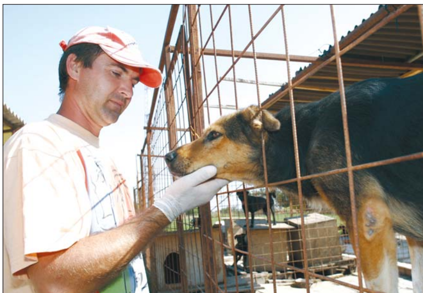
A pingyomi menhelyen kétszáznál is több kutyát gondoznak.

A martintelepi esettel kapcsolatban a Polgármesteri Hivatal Hatósági