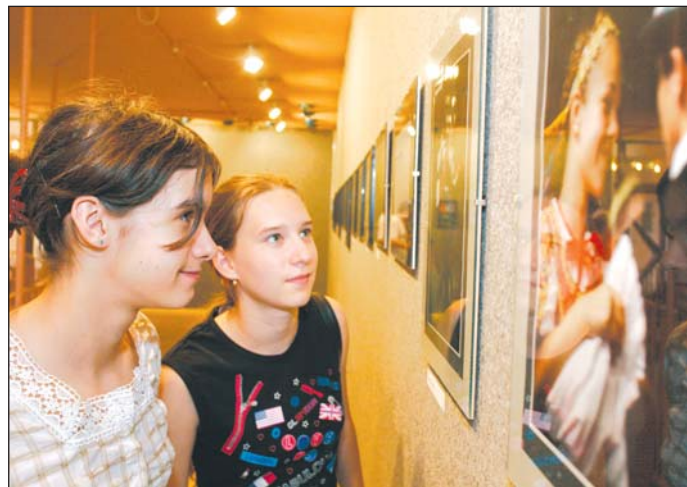
Az amatőr fotósok száma egyre nő.