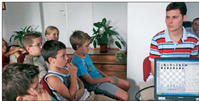
Élménybeszámolót tartott Miskolcon a róla elnevezett sakkiskolában Lékó Péter nemzetközi

nagymester, világbajnokjelölt. A volt világbajnoki döntős a Miskolci Sportiskola égisze alatt, a diósgyőri stadionban működő intézményben szerdán délután a világbajnoki selejtező során lejátszott legjobb játszmáját elemzte a gyerekeknek, akiknek mesélt a rendkívül fontos versenyen szerzett élményeiről is. A legjobb magyar sakkozó este sem maradt program nélkül: megtekintette a DVTK – DVSC labdarúgó-mérkőzést és a kezdőrájátszást elvégzésére is vállalkozott.