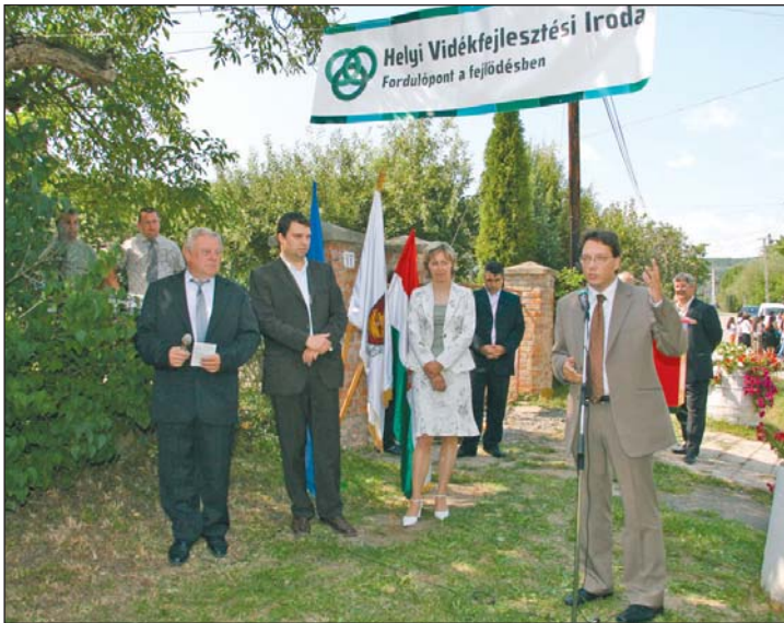
A szemerei iroda ünnepélyes átadása.

Az integrált, minden ágazatra kiterjedő vidékfejlesztés jegyében megtervezett, az Európai Mezőgazdasági Alapból finanszírozott Új Magyarország Vidékfejlesztési Program 2007 és 2013 között rendelkezésre álló fejlesztési forrásai új esélyt jelentenek a felzárkózásra. A szakminisztérium célja az, hogy az ehhez szükséges feltételeket megteremtse, és a kistérségi irodák a végrehajtás eszközei legyenek. Így nem a fővárosban, a