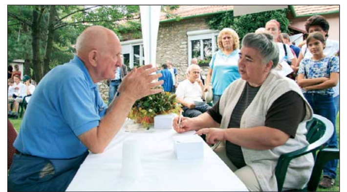
Több százan voltak kíváncsiak a „füvesember” tanácsaira.

Több százan látogattak el a hagyományteremtőnek szánt rendezvényre. A más megyékből is érkező érdeklődők előadásokat hallhattak a népi gyógyászat történetéről, a gyógynövények szerepéről az egészségvédelemben, részt vehettek gyógynövény-fel-