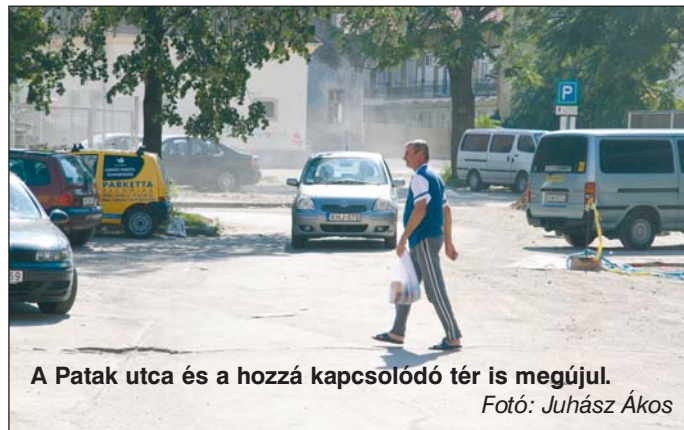
A Patak utca és a hozzá kapcsolódó tér is megújul.

egzaktak a kiírás feltételei, és az uniós elvárásoknak is vannak nehezen értelmezhető elemei a városrehabilitáció kapcsán. Ilyenek például a gazdaságossági tanulmányok, a megtérülési mutatók.