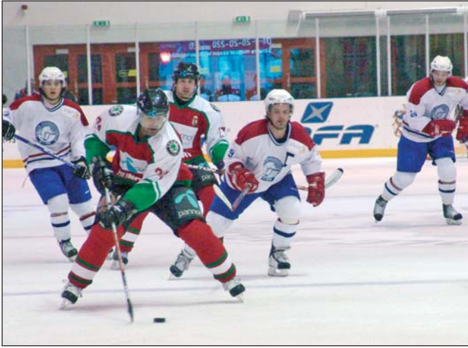
Felvételünkön még a nagy „Macik” edzenek.

A 18 éveseknek kitűnő megméretési lehetőséget biztosít az a rendezvény, amelyet augusztus 24-26. között rendeznek meg. Érdekesség: a csehek és a szlovákok egyaránt a 16 éves korosztály válogatottját küldik Miskolcra. Ennek