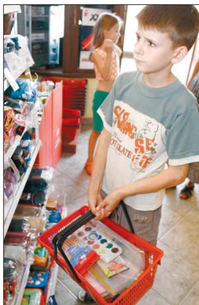
Az iskolakezdés jelentős anyagi terhet ró a családokra.

A város többi iskolájában is hasonló a készülődés. Véglegesítik a tantárgyfelosztást, az órarendet, áttekintik a helyi tantervet és az iskola