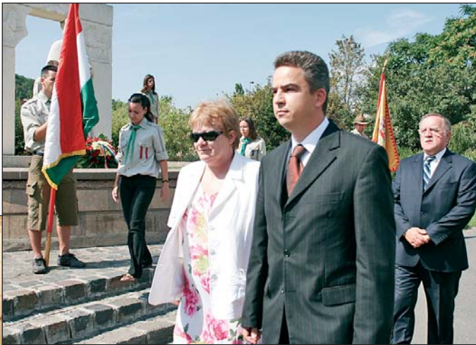
Koszorúzással kezdődött a megemlékezés.

ták. Elmaradt ugyanakkor a 22 órára tervezett tűzijáték. Este nyolckor döntött úgy a katasztrófavédelem, a rendőrség és a miskolci önkormányzat megbízásából az ünnepséget lebonyolító Miskolci Ifjúsági Ház, hogy aznap nem rendezik meg a tűzijátékot. A meteorológiai szolgálat előrejelzése szerint ekkorra volt várható az egész országon végigszáguldó vihar Miskolcra érkezése. Az égi show-t kedden pótolhatta be a több ezer miskolci.