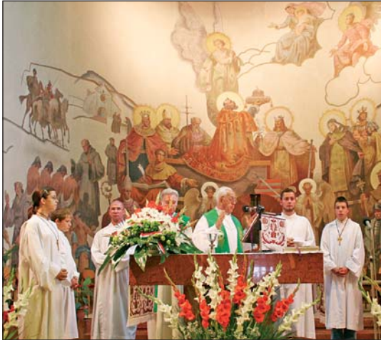
A Szent István-templomban megáldották az új kenyeret.

gatók a Tip-Top Dixie koncertjét, a Pécsi Sándor Gyermekek Színház musical-összeállítását és a Szinvalögyi Táncegyüttes bemutatóját láthatják.