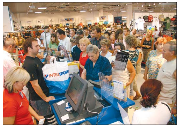
Óriási tömeg várta a nyitást.

Már a nyitás előtt fél órával hosszú sor kígyózott Miskolc legújabb üzletközpontja előtt. A múltat idéző sorban állás oka – az újdonság mellett – elsősorban az üzletek nyitási akciója. Volt, aki engedélyes cipőt, szabadidőruhát, focilabdát akart vásárolni. Választék mindből akadt bőven, hiszen a bevásárlóudvarban túlnyomórészt ruházati üzletek és sportbolt található. A borsodi megyeszékhelyen élők számára azonban nem csak az