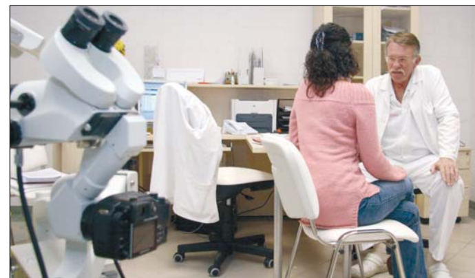
A központban minden rendelkezésre áll.

a lehetőségét, hogy a pár héttel ezelőttihez hasonló vízhiány forduljon elő? Köztudott ugyanis, hogy Miskolc ivóvízellátásának a kétharmadát a tapolcai, úgynevezett Olasz-kút adja, így ennek kizárása a rendszerből komoly problémát jelenthet. A karsztbázisban kiépülő monitoring-rendszer pedig még hamarabb jelzi majd az esetleges fellépő szennyezéseket, így növekszik a biztonság, de továbbra is megmarad a kút leállításának valószínűsége. Ezzel kapcsolatban Korózs András megjegyezte, korábban is voltak különböző elképzelések arra, hogy honnan lehetne ivóvízhez