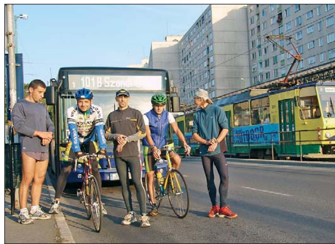
Idén is megrendezik az úgynevezett eljutási versenyt.

Szeptember 17-én Közlekedj más-képp – egy élhetőbb városért! a Városház téren. 7–8.30 óra között reggeli kétkerekesekek, reggelivel várnak a kerékpárral munkába, iskolába járókat a Mesterek Éttermének finom falataival. 7.30-tól Eljutási verseny (villamos, autóbusz, autó, futó, kerékpár): a diósgyőri vil-