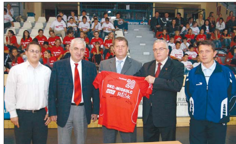
A Miskolc Holding Zrt. és a klub képviselői mutatták be a csapat új mezét.