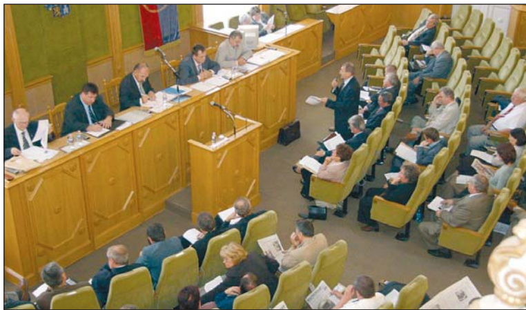
A csanyiki szanatórium eladását is tárgyalta a grémium.

Az ülés kiemelt témája a költségvetés első félévének teljesítés-