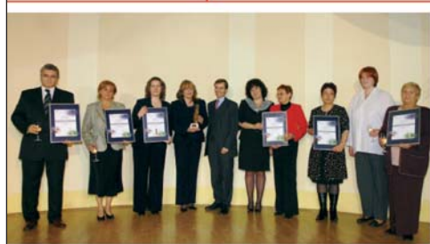
A 2006-05 Holcim Díj nyertesei és a Holcim képviselői

A pályázat fődíja egymillió forint értékű cement-utalvány , amelynek tervezett felhasználását a beküldendő pályázatnak részletesen tartalmaznia kell.