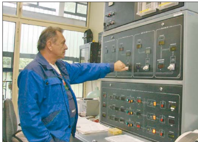
A tapolcaihoz hasonló monitoring-rendszer épül a karsztforrásoknál is.