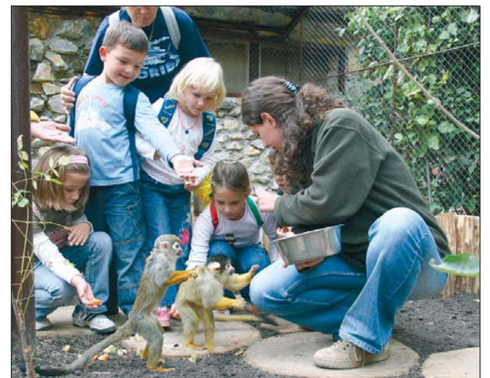
Az állatkertben testközelből lehet például a mókusmajmokkal ismerkedni.

Az állatok világnapja az állatszeretetéről ismert Assisi Szent Ferenc ünnepe, aki már a 13. század elején azt hirdette, hogy szeretnünk kell élő környezetünket. Magyarországon 1991 óta ünnepeljük az állatok napját. Az állatokat nemcsak a világnapon, hanem az év minden napján óvunk és védünk, legyen az házi vagy vadon élő. Erre hívja fel a figyelmet a Miskolci Állatkert és