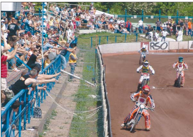
Az év legrangosabb versenyén szurkolhatnak a miskolciak.

Ez egyben azt is jelenthette volna, hogy a magyar szurkolók egy világbajnoki visszavágónak lehetnek szemtanúi a népkerti Speedway arénában. Anról volt szó ugyanis, hogy az ausztrál világső megmérkőzik az idei világbajnokkal, a dán Nicki Pedersenrel ezen a nem mindennapi viadalon. A salakmotoros Bajnokcsapatok Európa Kupájának döntőjében a lengyel Atlas Wrocław, a selejtezőből feljutott horvát Unia Gorican, a több-