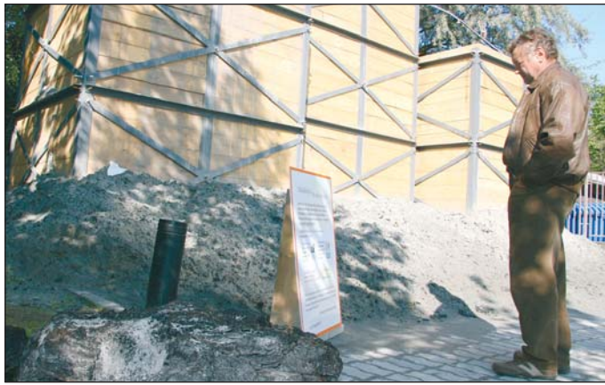
A fatörzsek most még az ideiglenes tárolókban, homokba ágyazva várnak a tartósításra.