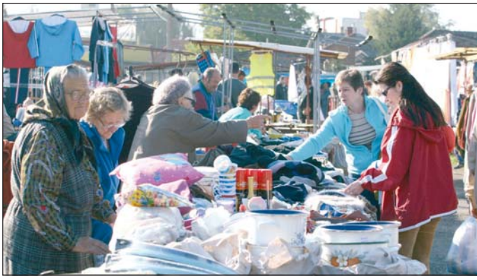
Eladókban, vásárlókban most sincs hiány.

A Zsarnai telep és piac kialakulásáról, sorsáról alapos elemzést közöl Dobrossy István piaci monográfiája. (Piac, vásár, sokadalom Miskolcon – 2002). E szerint a hajdani ártéri kaszáló egykori tulajdonosáról, a Zsarnai családról kapta a nevét. A rétből úgy lett telep, hogy feltöltötték, és a téglagyári, kertészeti, valamint a Gömöri pályaudvar környéki ipartelepeken dolgozó munkások fokozatosan elkezdtek itt kis lakásokat építeni. A háború után, az 1950-es éveket követően megszűnt Miskolcon a lóverseny- és állattársártér, szükség volt új piactér kijelölésére. A Zsarnai telep így alakult át „a Zsarnai”-vá, amely az 1980-as években lengyel piacoként, KGST-piacoként került a köztudatba. Gyakorlatilag mindent meg lehetett itt vásárolni – a bolti árnál jóval kedvezőbbben – a különféle ruhane-műtől kezdve, a kozmetikumokon,