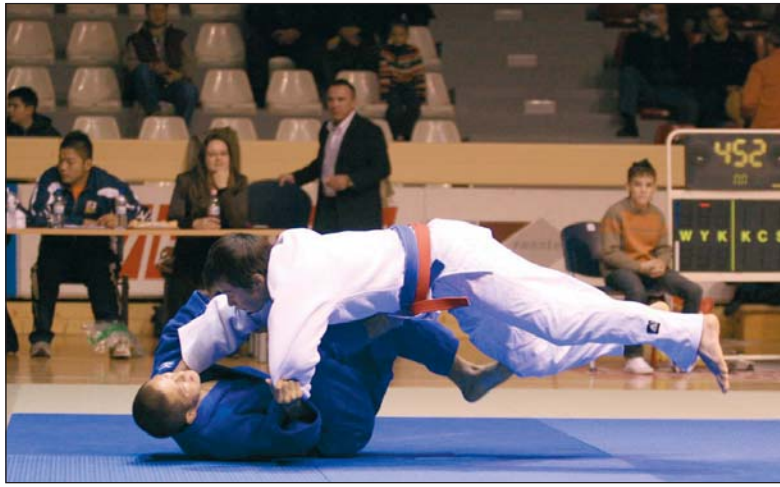
A bemutatón látványos pillanatoknak is tapsolhatott a közönség.

A magyarokról is faggatták a vendégeket a jelenlévő zsurnalisták. Udvariasan válaszoltak, s azt emelték ki, hogy a mieink elsősorban földharcban képesek jó teljesítményre. A japán együttes tagjai a Miskolci Városi Szabadidőközpontban színvo-