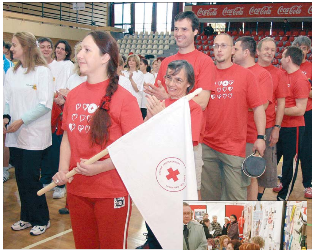
A szociális dolgozók sportnapját a sportszarnokban tartották. Az Erzsébet téren információs nappal várták az érdeklődőket.

A Szociális Munka Hete november 5-én a Győri Nemzeti Színház társulatának vendégjátékával indult, másnap pedig Szociális Információs Napot tartottak az Erzsébet téren – kulturális programokkal, szociális tolván, nyereménysorsolással. Az érdeklődők itt tájékoztatást, információkat kaphattak a szociális és gyermekjóléti-gyermekvédelmi intézmények, civil szervezetek szolgáltatásairól, a különféle ellátási, támogatási formákról. Szerdán gyermekvédelmi konferencia kezdődött a Városházán, melyen más helyi és fővárosi szakértők mellett részt vett Ferge