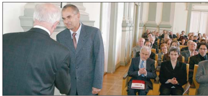
Az akadémia tizenkét kutatót díjazott.