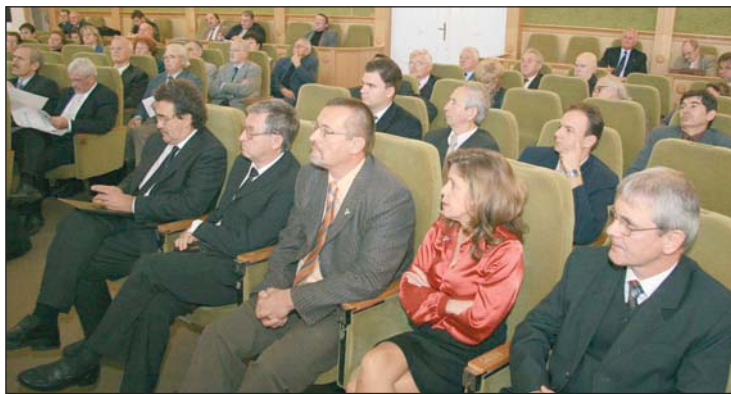
Plenáris üléssel kezdődött a rendezvény.

Miskolcon a Megyeháza dísztermében plenáris üléssel kezdődött az ünnepi rendezvény-sorozat. Itt az energiagazdálkodás, a mezőgazdaság és a tu-