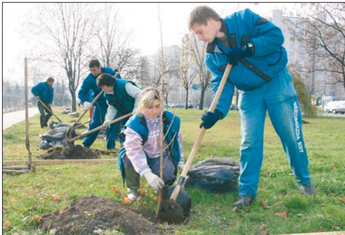
Ötven facsemetét már el is ültettek.

A Király utcai ültetés után a Ládi telepen és a Komlóstetőn gödrök ásásával folytatódott az Északerdő Zrt. és a Városgazda Kht. akciója.