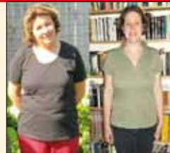
Kata 15 kilót fogyott 2 kúrával. Ön is képes rá!

Bejelentkezés: 06-70/369-2283 vagy 06-20/554-2906 www.atfomalo.hu